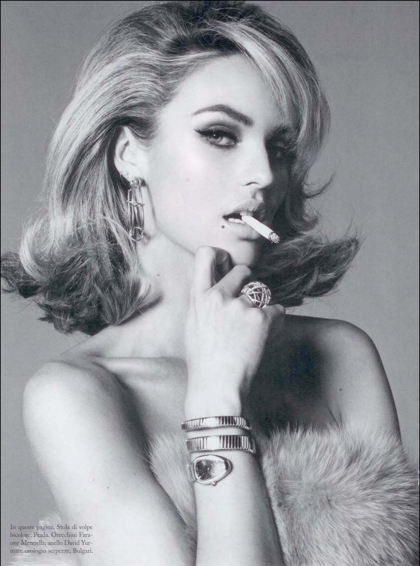
In queste pagine, Stola di volpe bicolore, Prada. Orecchini Faraone Mennella; anello David Yurman; orologio serpente, Bulgari.